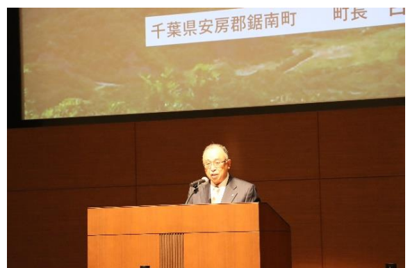
白石町長による講演