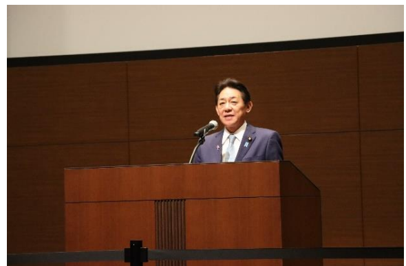
挨拶する松村内閣府特命担当大臣（防災）