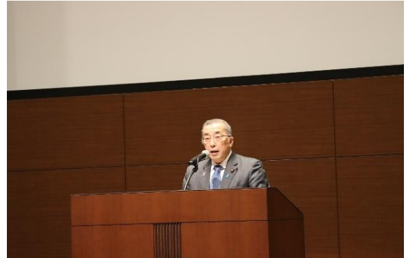
挨拶する鈴木総務大臣